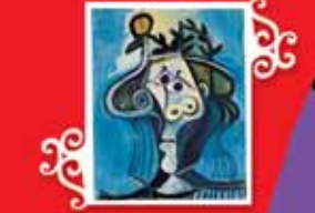
KADIN Mougins, 7 Temmuz 1971 Tuval üzerine yağlı boya, 81x65 cm Özel koleksiyon © Succession Picasso 2005.