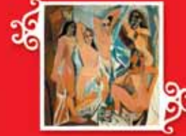
AĞIGNON'LU KIZLAR Ozğün Tablo, 1957, Dokuma: 1958 Yün, 272x260 cm Özel koleksiyon © Succession Picasso 2005.