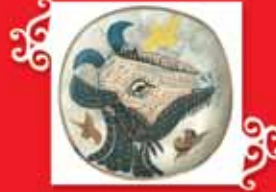
KEÇİ BAŞI Vallauris, 1952-53 Seramik, 40x40 cm Özel koleksiyon © Succession Picasso 2005.