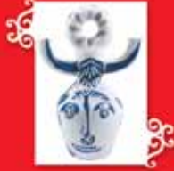
BOĞA BAŞLARI Vallauris, 1950-51 Seramik, 51x37 cm Özel koleksiyon © Succession Picasso 2005.