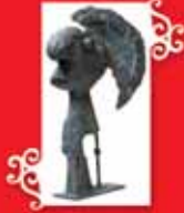
SAVAŞÇI BAŞI Borsajetoup, 1933 Bronz, 121x69x32 cm Özel koleksiyon © Succession Picasso 2005.