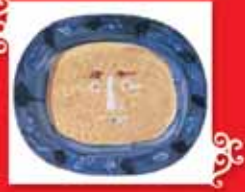
YÜZ Vallauris, 11 Ekim 1947 Seramik, 32x28 cm Özel koleksiyon © Succession Picasso 2005.