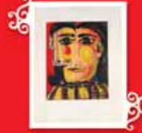
KADIN BAŞI NO 5, DORA MAAR PORTRESİ Paris, Ocak-Haziran 1939 Renkli gravür, 29,9x23,7 cm Özel koleksiyon © Succession Picasso 2005.